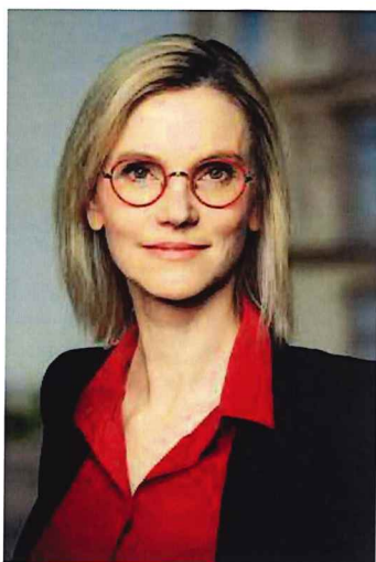
Agnès Pannier-Runacher, ministre de la Transition énergétique