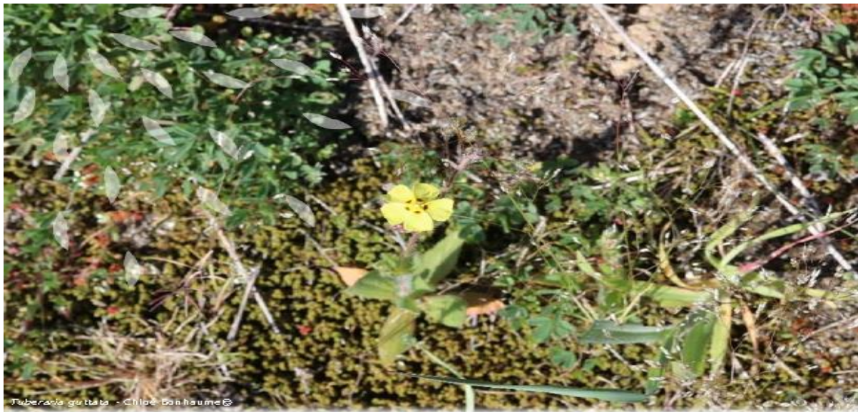
Tabernaemontana guibarta - Clément Bonhomme ©

Les communes du TIGNET et de PEYMEINADE se sont associées pour élaborer un Atlas Communal de la Biodiversité . Dans ce cadre, le Centre de l'Environnement Naturel / CEN de la région PACA et la LPO vous proposent deux évènements pour découvrir la faune et la flore de votre commune